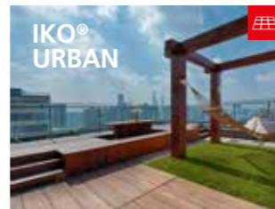
Het bewezen daksysteem voor intensief gebruik in het stedelijk dakenlandschap