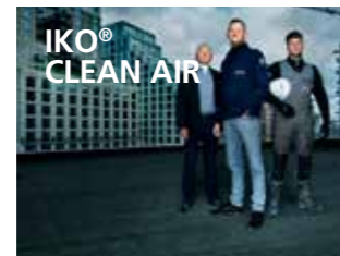
Het bewezen daksysteem met een ultra lange levensduur