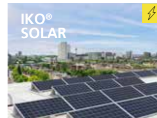
Het bewezen daksysteem voor zonnepanelen