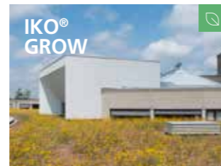
Het bewezen daksysteem voor intensieve dakbegroeiing