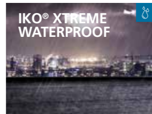
Het bewezen daksysteem voor optimaal waterbeheer en bescherming