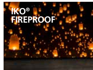
Het bewezen daksysteem voor ultieme brandveiligheid